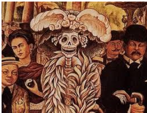
La anterior imagen representa el muralismo mexicano